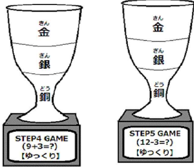
(くりあがりのあるたしざん) (くりさがりのあるひきざん)